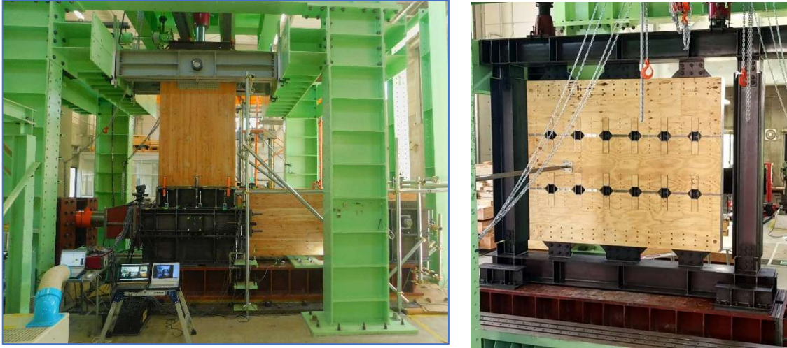
【実大実験の様子（左：GIUA、右：シアリングコッター耐力壁）】