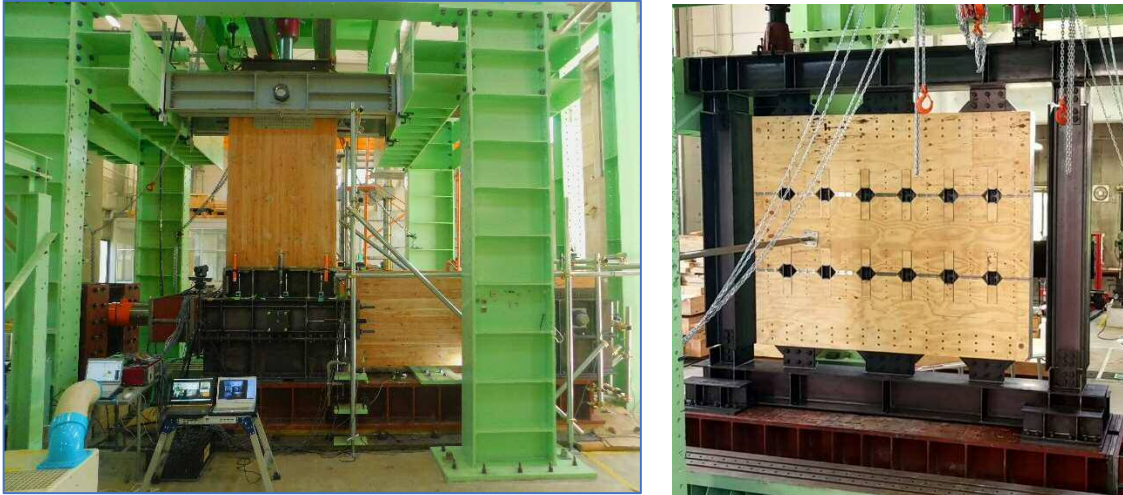
【実大実験の様子（左：GIUA、右：シアリングコッター耐力壁）】